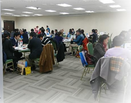
▲平成29年度商談会の様子