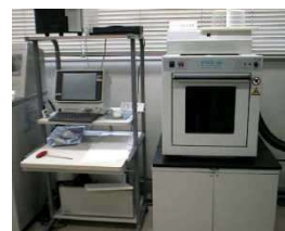
マイクロ波反応装置