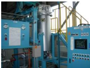
超臨界抽出装置・高温高压マイクロリアクタ